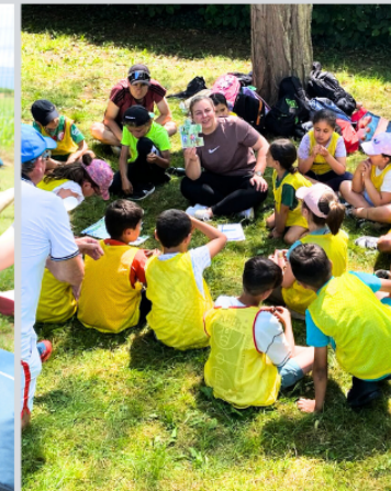
discussion autour de l'usage raisonné des écrans