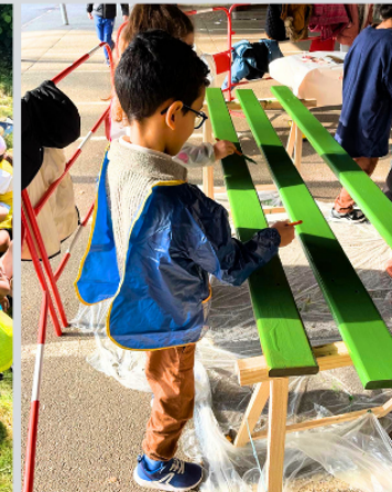
préparation du banc de l'amitié