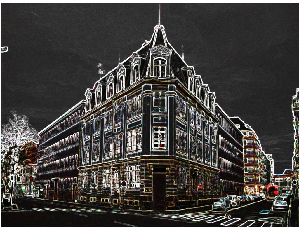
Boulevard du Président Poincaré, Strasbourg. Inspiration Ciepas