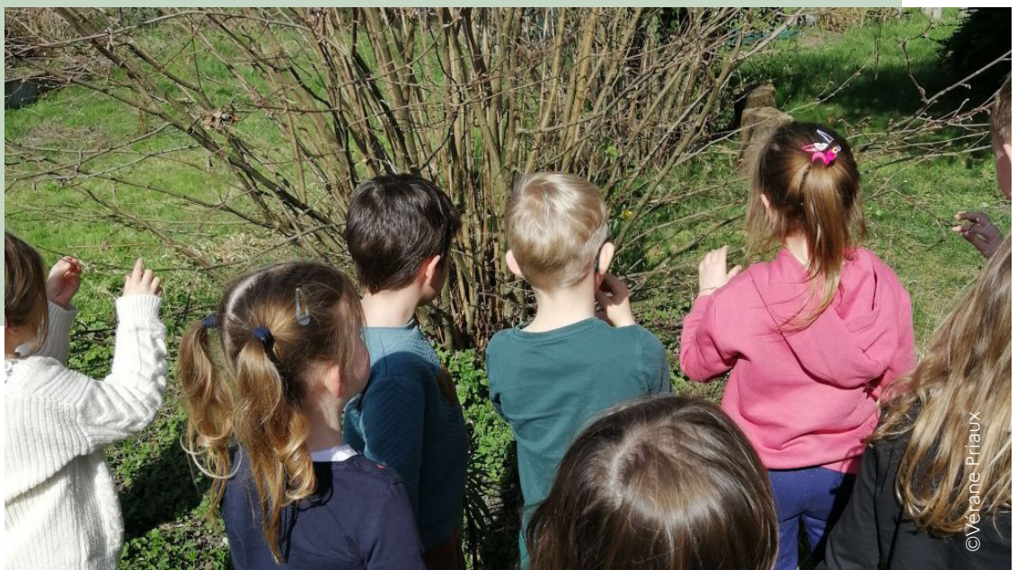
Les élèves de grande section et de CP de l'école primaire de Rossfeld observent les étapes du développement d'un végétal sur un saule planté en automne 2023 dans l'espace nature.