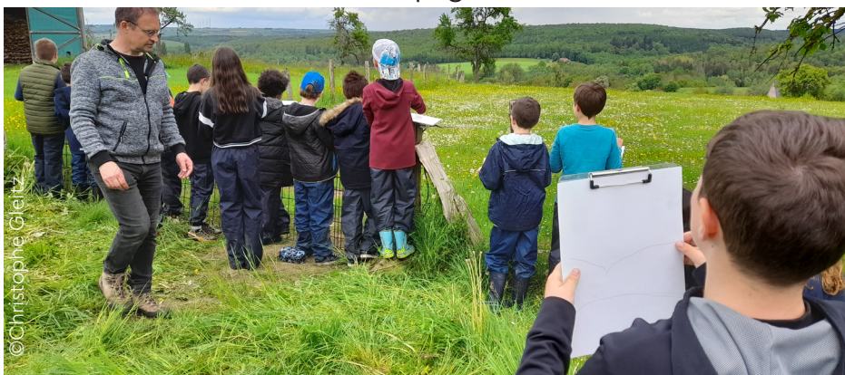
Lecture de paysages à proximité du village, avec les élèves de cycle 3 de l'école de Waldhambach.