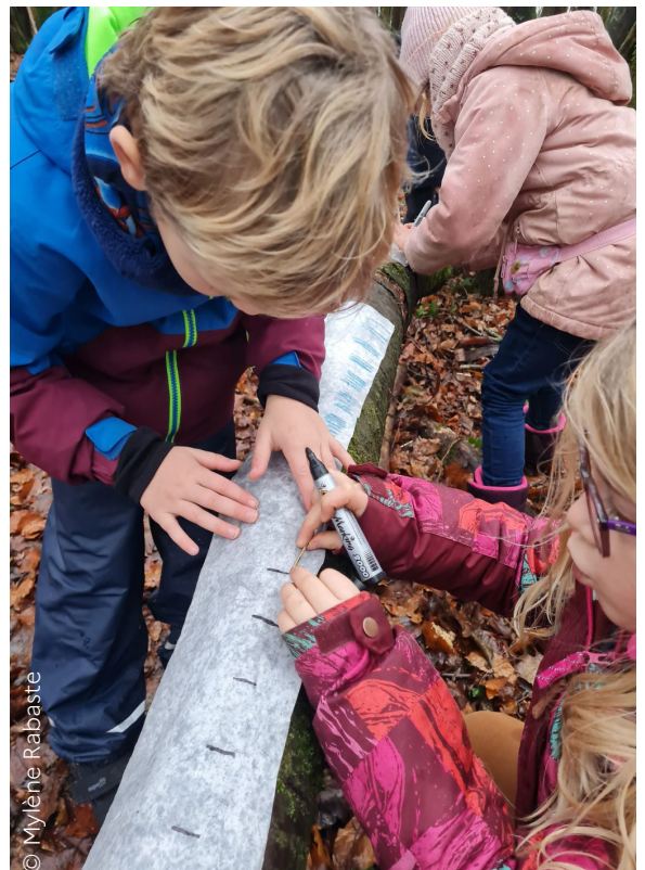
Les élèves de CP / CE1 de l'école primaire de Friesen travaillent sur la mesure de longueurs. Ils ont créé une règle en marquant des graduations à l'aide d'une allumette comme étalon. Cette règle a ensuite été utilisée pour mesurer les circonférences des arbres.

L'École du dehors favorise l'engagement des élèves et le développement de compétences transversales dans une dynamique d'expérimentation et de coopération, tout en renforçant l'apprentissage des fondamentaux.