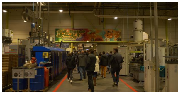
Soirée « familles/entreprises » à l'entreprise Sew Usocomme organisée par le CLEE de la Moder