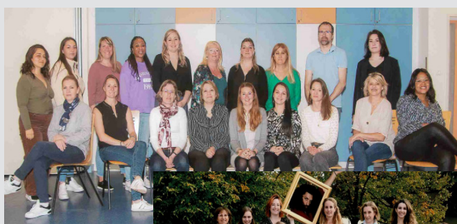
École maternelle du Ried