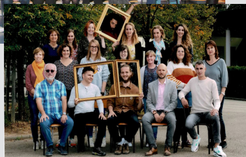
École élémentaire Bouchesèche