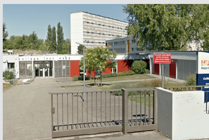
Le collège Jean Macé de Mulhouse