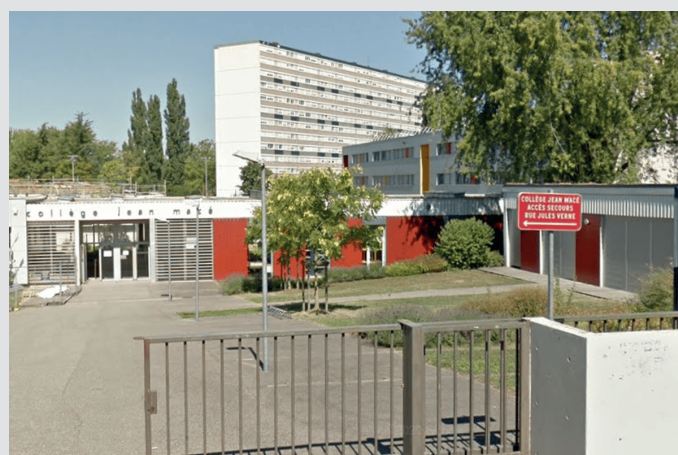
Réseau Rep+ Jean-Macé de Mulhouse