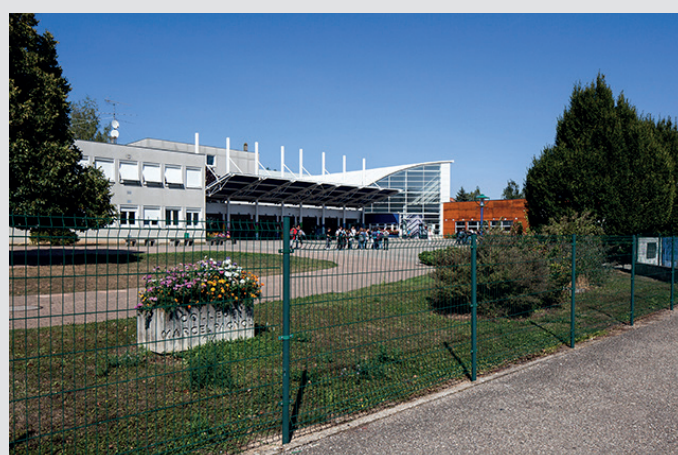
Le collège Marcel Pagnol de Wasselonne