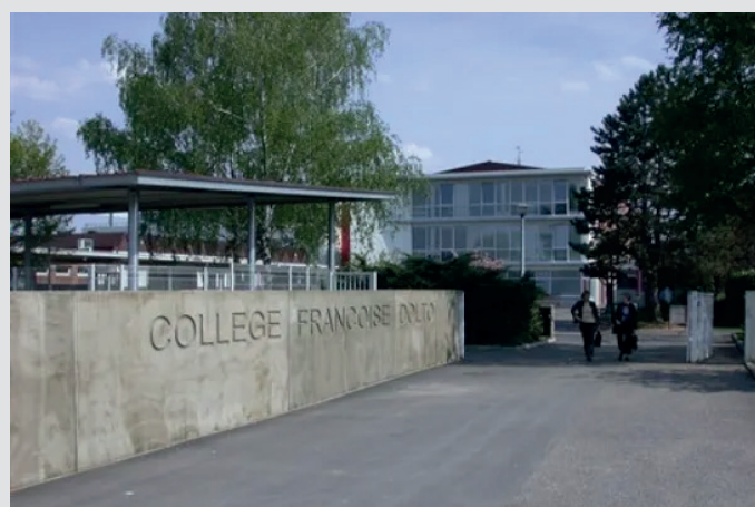
Collège Françoise Dolto de Sierentz