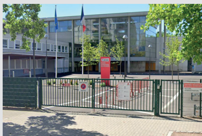
Collège de l'Esplanade de Strasbourg