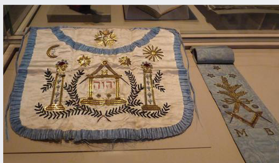
TABLIER DE MAÎTRE DE JEAN MACÉ. MAIRIE DE BEBLENHEIM

EN 1866, JEAN MACÉ DEVIENT FRANC-MAÇON, INITIÉ À LA LOGE « LA PARFAITE HARMONIE » DE MULHOUSE. IL FRÉQUENTE AUSSI LES LOGES DE COLMAR ET DE STRASBOURG. AUJOURD'HUI, BEAUCOUP DE RUMEURS ET DE THÉORIES COMLOTISTES CIRCULENT SUR INTERNET À PROPOS DE LA FRANC-MAÇONNERIE. CETTE PARTIE DE NOTRE EXPOSITION VOUDRAIT DONC EXPLIQUER :