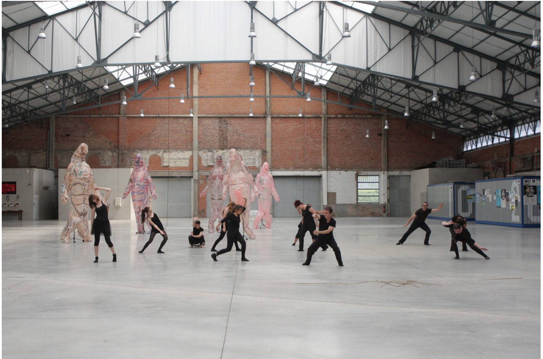
Stage de danse contemporaine en été