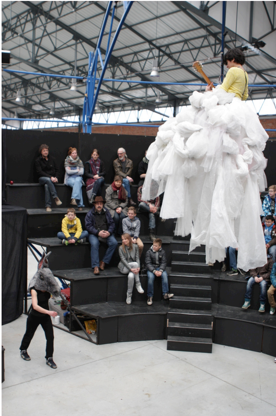
Sortie d'usine de Cheptel-Aleikoum