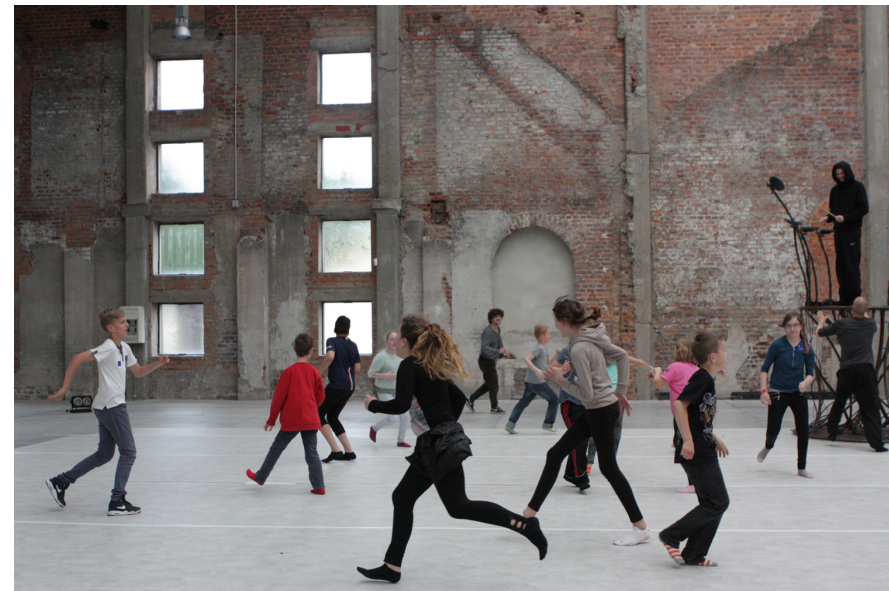
Journée à la Halle

Vous avez envie de mener un projet artistique (arts visuels, théâtre, marionnettes, danse, etc...) en collaboration avec un artiste ?