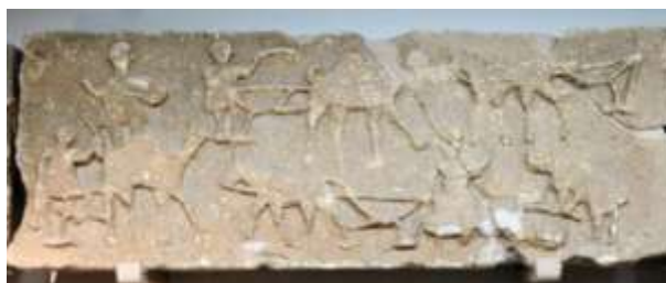
Relief du mausolée de Ghirza (Libye)