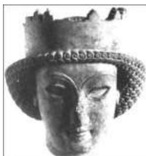
Portrait de princesse