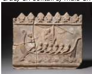
Terre cuite dite « Plaque Campana », musée du Louvre