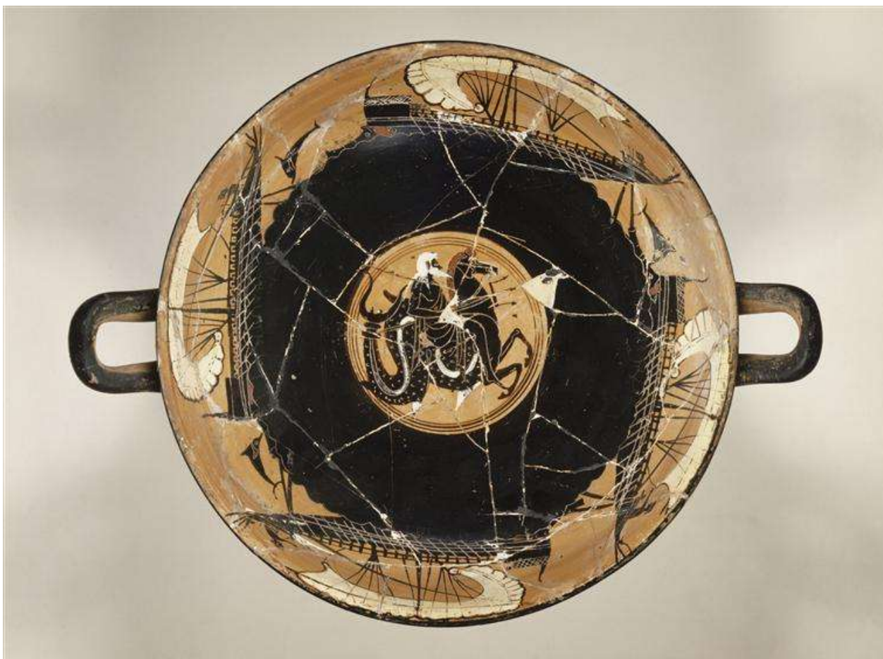
Poséidon sur un hippocampe et quatre navires