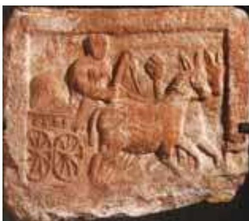
Stèle en grès, 1 er s. ap. J.-C.

http://www.musagora.education.fr/gaulois/default.htm