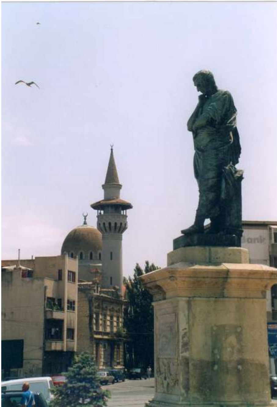
Statue d'Ovide à Constantza