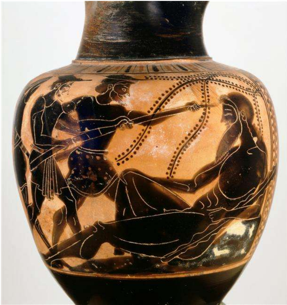
Oenoché à figures noires, v. 500 av. J.-C.