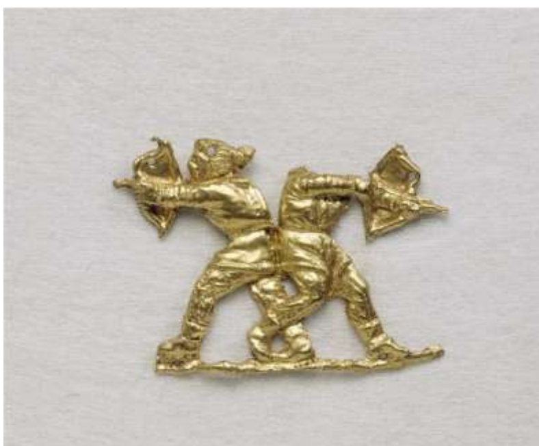
Archers scythes (4 e s. av. J.-C.)

LXV. Les Scythes n'emploient pas à l'usage que je vais dire toutes sortes de têtes indifféremment, mais celles de leurs plus grands ennemis. Ils scient le crâne au-dessous des sourcils et le nettoient. Les pauvres se contentent de le revêtir par dehors d'un morceau de cuir de boeuf, sans apprêt ; les riches non seulement le couvrent d'un morceau de peau de boeuf, mais ils le dorent aussi en dedans et s'en servent, ainsi que les pauvres, comme d'une coupe à boire. Ils font la même chose des têtes de leurs proches, si, après avoir eu quelque querelle ensemble, ils ont remporté sur eux la victoire en présence du roi. S'il vient chez eux quelque étranger dont ils fassent cas, ils lui présentent ces têtes, lui content comment ceux à qui elles appartenaient les ont attaqués, quoiqu'ils fussent leurs parents, et comment ils les ont vaincus. Ils appellent cela des actions de valeur.