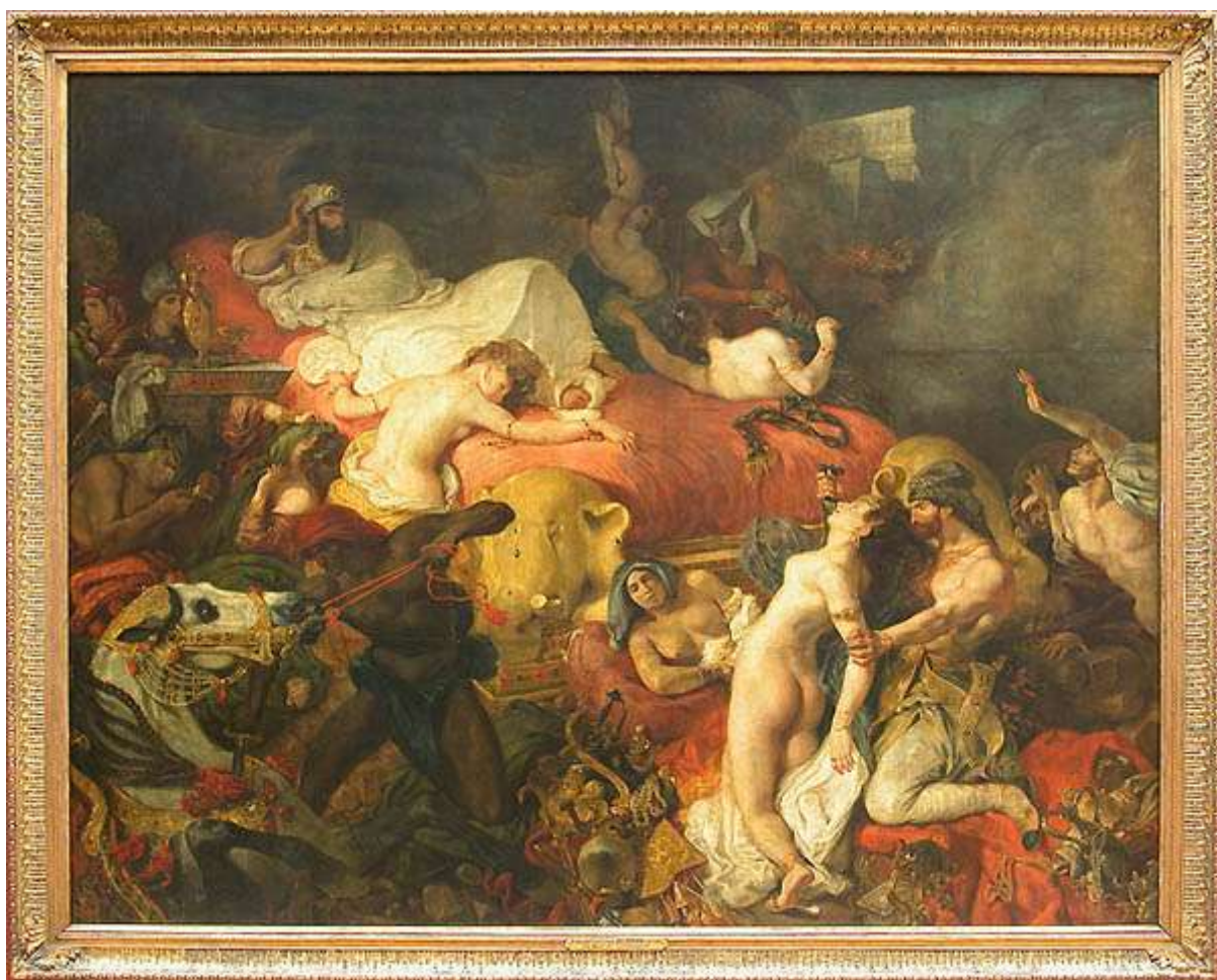
Eugène Delacroix, Mort de Sardanapale (1827), Musée du Louvre

On pourra comparer le mythe de Sardanapale à celui d'une autre figure de l'Orient, la reine d'Égypte Cléopâtre, dont les Romains eurent davantage à se plaindre en raison des menaces qu'elle fit courir à l'empire.