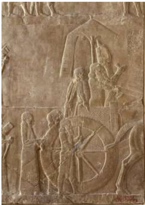
Assurbanipal sur son char, Musée du Louvre