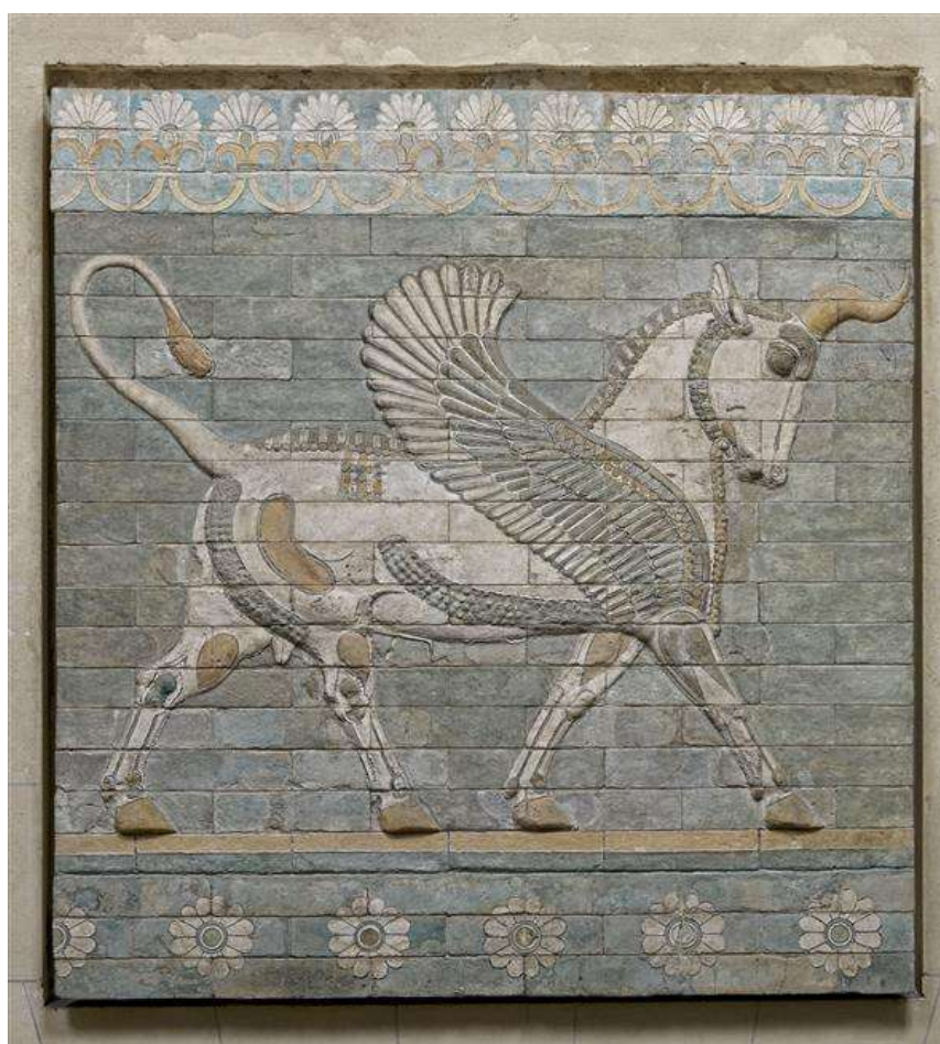
Taureau ailé, palais de Darius I à Suse

Enfin Darius manœuvre pour être choisi comme roi.