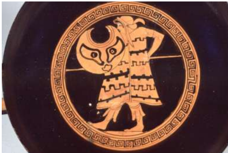
Guerrier en costume barbare