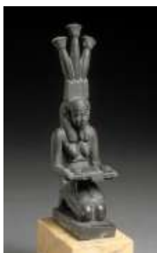
Statuette du dieu Nil Musée du Louvre

Hérodote a voyagé en Égypte, surtout dans le delta et à Memphis, et jusqu'à Assouan, affirme-t-il (II, 29) ; il a observé que le Nil se comportait à l'inverse des cours d'eau de son Asie mineure natale : ses crues sont en été alors qu'il ne pleut pas. De là l'idée que les hommes d'Égypte aussi se comportent de façon inverse.