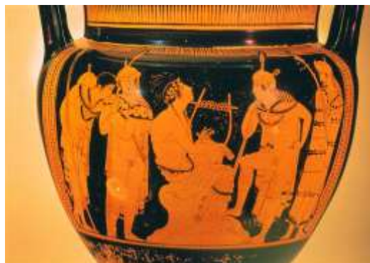
Orphée chez les Thraces, Berlin, Antikensammlung

Les femmes même ont une grande force de caractère : quand leurs maris meurent, leur vœu le plus cher est d'être immolées sur leurs cadavres et ensevelies dans le même tombeau ; et, comme souvent un homme a plusieurs femmes, celles-ci se disputent vivement cet honneur devant les juges établis pour prononcer sur le différend. La préférence est le prix de la vertu, et l'épouse qui en est jugée digne est au comble de la joie, tandis que les autres se lamentent et se livrent aux excès du plus affreux désespoir. Ceux qui veulent les consoler se rendent auprès du bûcher avec des armes et de l'argent, déclarant qu'ils sont prêts, s'il y a lieu, à traiter ou à se battre avec le génie du défunt ; et comme la provocation reste sans effet, les veuves passent de la douleur à de nouvelles amours. Les parents ne choisissent pas d'époux à leurs filles nubiles, mais ils les mènent sur la place publique, et là on les livre à qui veut les épouser ou bien elles sont vendues. La beauté et les mœurs font la différence des marchés : on vend celles qui sont belles et vertueuses ; on paye ceux qui consentent à prendre les autres. Quelques-uns de ces peuples ignorent l'usage du vin ; mais ils y suppléent dans leurs repas en jetant sur le feu, autour duquel ils s'assemblent, certaines semences dont l'odeur les enivre et les porte à la gaieté.