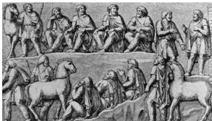
Conseil de guerriers germaniques, d'après la colonne de Marc-Aurèle.

Et l'on découvre, comme dans d'autres textes, une image de « bons sauvages » : la pureté des moeurs, et notamment la continence des femmes.