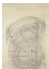
18. H. GUIMARD, modèle de motif pour le métro, 1900