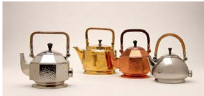
7. P. BEHRENS, Bouilloires, 1909