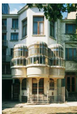
17. V. HORTA, Hôtel particulier, 1904, Bruxelles.