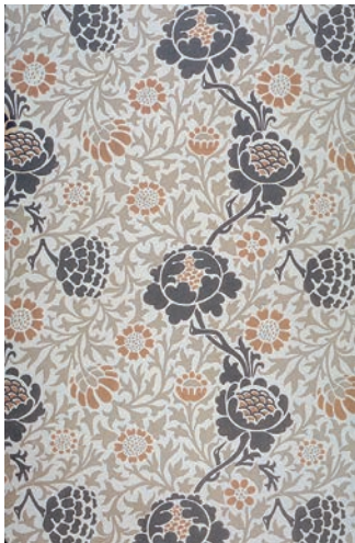
1. W. MORRIS, Motif de papier peint, 1883

Les artistes du milieu du siècle redoutent l'appauvrissement de la qualité en raison de la mise en place de nouveaux processus de fabrication. En Grande-Bretagne , John Ruskin , qui se fonde sur l'observation de l'art médiéval, affirme dans ses essais la dignité du travail et de l'artisanat. L'influence du néo-gothique anglais et du courant réformateur des arts appliqués développés par Ruskin , est essentielle pour les artistes de l'Art nouveau. Ses idées influencent des personnalités telles qu' Émile Gallé , Josef Hoffmann , Henry Van de Velde et Antonio Gaudí . Comme Ruskin , William Morris encourage un renouveau dans les techniques d'artisanat traditionnelles. Créateur, écrivain et penseur, il défend l'artisanat et s'élève contre l'asservissement qui ôte toute dignité au travail. Il prend aussi comme modèle le système de production des guildes médiévales. Morris engage le combat pour l'amélioration du cadre de vie : n'avoir chez soi que du beau et de l'utile. Il fonde sa firme en 1861 , produit papiers peints, tissus, vitraux, tapisseries (1). Il s'associe avec Dante Gabriel Rossetti et Edward Burne-Jones . Socialiste convaincu, il s'oppose à la division du travail, prône l'utilisation de matières premières de grande qualité. Il entend réformer le goût et les mœurs, il préconise de ressusciter les anciens savoir-faire, de traiter la matière en fonction de ses spécificités et de choisir les objets en fonction de leur beauté et utilité.