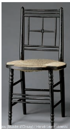
2. Chaise (Musée d'Orsay) / Hervé Lewandowski

Les idées de Morris entraînent la formation d'un mouvement qui acquiert son nom en 1888 l' Arts and Crafts Exhibition Society . Bien que nées d'un esprit romantiquement anti-industriel, les propositions des Arts&Crafts avec leur simplicité, la distinction nette entre éléments fonctionnels et interventions décoratives, la sobre rationalité de l'ameublement, servent d'inspiration à de nombreuses réflexions ultérieures, faisant de Morris un précurseur peut-être involontaire des recherches modernes du design. La tendance des artistes Art nouveau à travailler en atelier, en particulier en Autriche , s'inspire de l'idéologie romantico-socialiste du mouvement Arts and Crafts anglais.