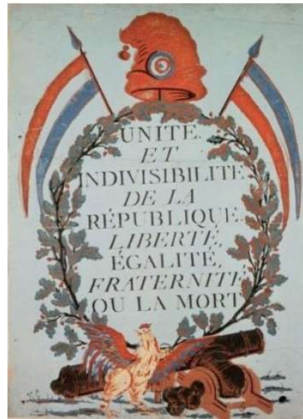
Exemple du XVIII e siècle, représentant le devise de la République française d'alors

Héritage du siècle des Lumières, la devise "Liberté, Égalité, Fraternité" est invoquée pour la première fois lors de la Révolution française. Souvent mentionnée en cause, elle finit par s'imposer sous le I er Empire républicain. Elle est inscrite dans la constitution de 1854 et fait aujourd'hui partie de notre patrimoine national.