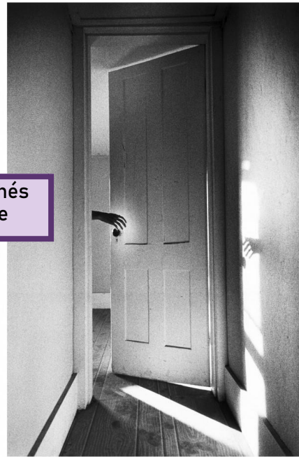
Ralph Gibson, « Hand through door », Somnambulist, 1970