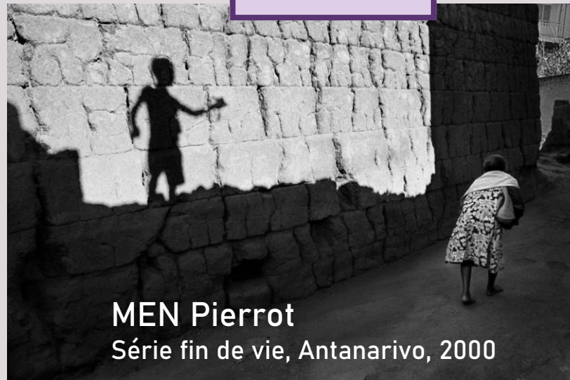
MEN Pierrot Série fin de vie, Antanarivo, 2000