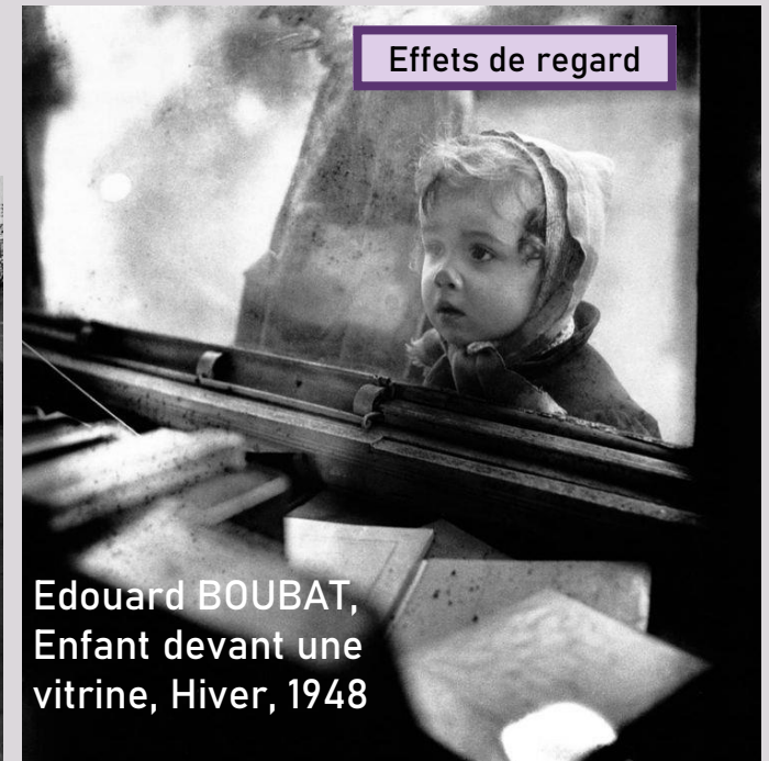
Edouard BOUBAT, Enfant devant une vitrine, Hiver, 1948