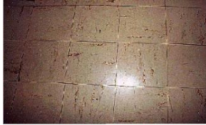
Dalles de sol