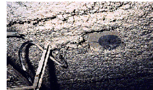
Flocage de plafond