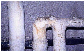
Calorifugeage de tuyaux