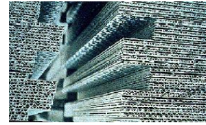
Plaques de faux-plafond