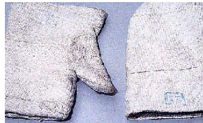
Gants de protection